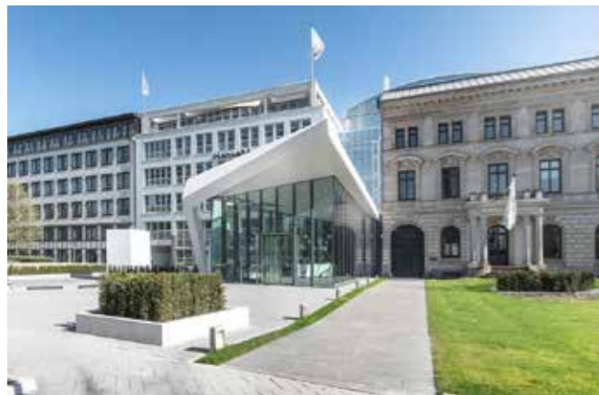
Hanse Merkur Für die Hanse Merkur Versicherungsgruppe übernehmen wir bereits seit 1994 die Wartung und weitere Services der RWA- und Feststellanlagen.