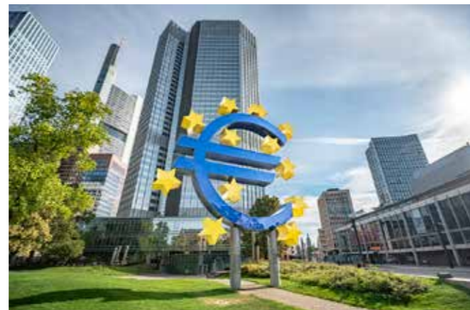
Europäische Zentralbank (EZB) In vielstöckigen Gebäuden sind Aufzugschachtenrauchungsanlagen elementarer Bestandteil des RWA-Konzepts. In der Zentrale der EZB kümmern wir uns um die Wartung und Instandhaltung dieser Systeme.